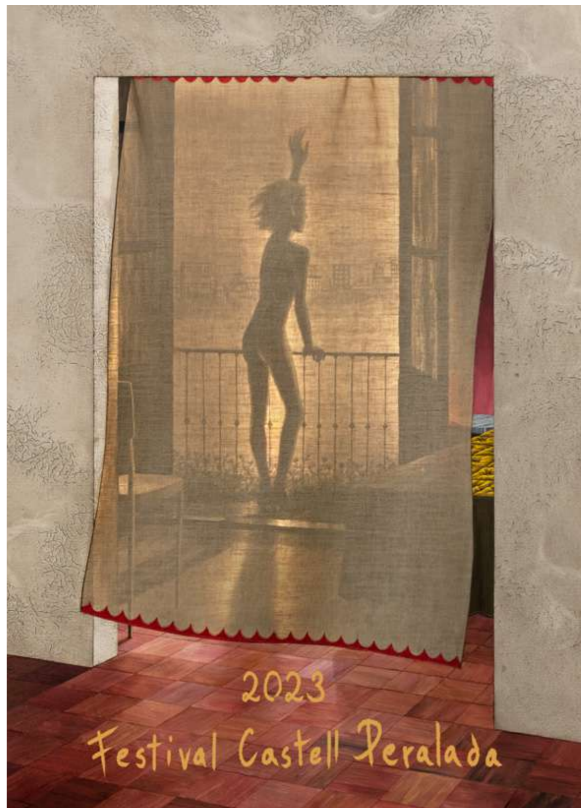
Cartell del Festival Peralada 2023: La Despedida ©Gino Rubert.